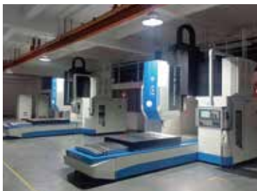
搅拌摩擦焊龙门设备案例