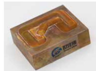
搅拌摩擦焊消除尾孔焊接