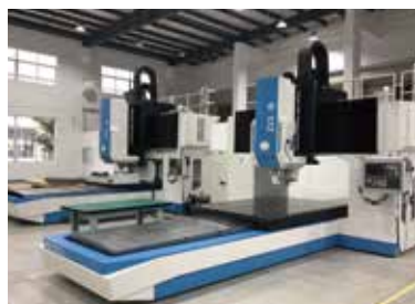
搅拌摩擦焊龙门设备案例