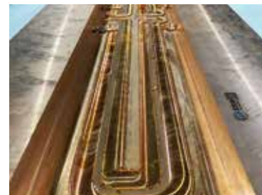
搅拌摩擦焊铜冷板