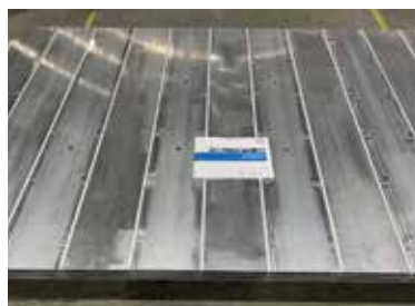
搅拌摩擦焊电池托盘