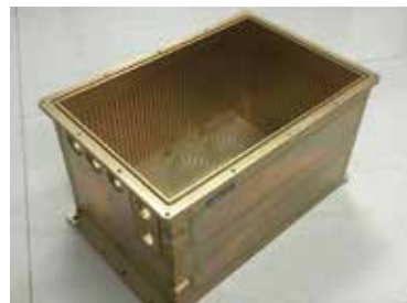
搅拌摩擦焊水冷箱体