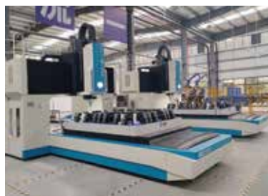
搅拌摩擦焊龙门设备案例