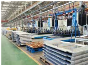
搅拌摩擦焊龙门设备案例