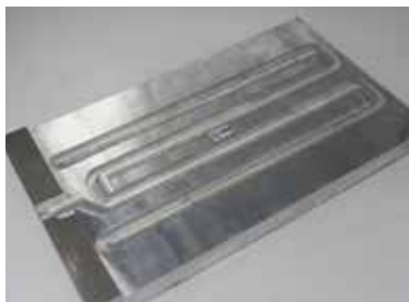
搅拌摩擦焊铝合金水冷板