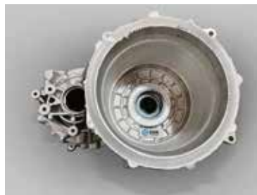
搅拌摩擦焊电机筒 (内外圈)