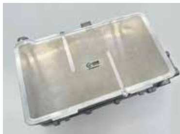
静轴肩压铸铝合金驱动器壳体