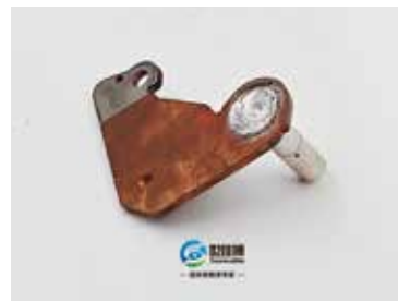
搅拌摩擦焊铜-铝软连接