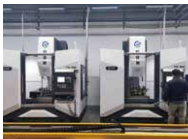
搅拌摩擦焊项目案例(自动化产线)