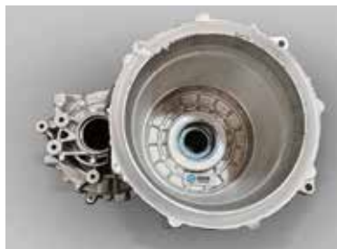
搅拌摩擦焊双电机筒 (内外圈)