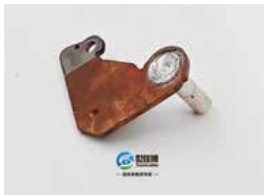
搅拌摩擦焊铜、铝软连接