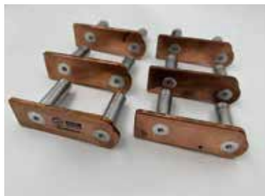
搅拌摩擦焊铜铝异种焊接