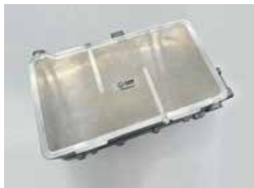
静轴肩压铸铝合金驱动器壳体