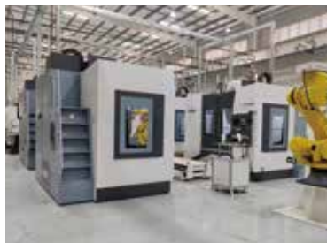
搅拌摩擦焊项目案例(自动化产线)