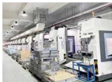
搅拌摩擦焊项目案例