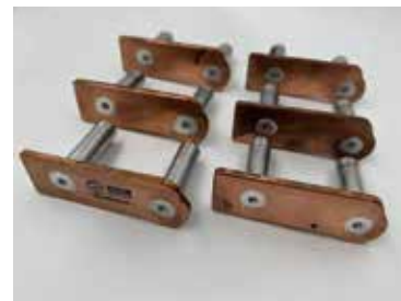
搅拌摩擦焊铜铝异种焊接