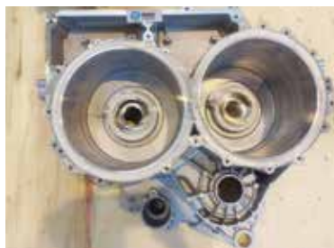
搅拌摩擦焊双电机筒 (内外圈)