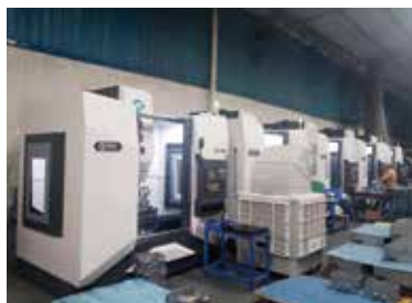
搅拌摩擦焊项目案例