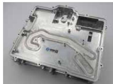
搅拌摩擦焊驱动器壳体