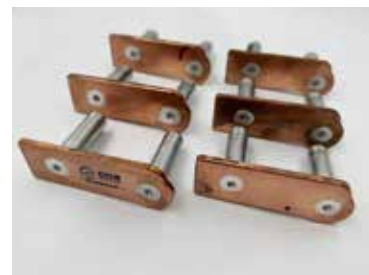
搅拌摩擦焊铜铝异种焊接